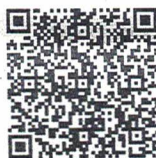
Get the free App from iTunes Store

Pls scan following QR code for download the App.