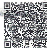
Get the free App from Google Play store

3. Pls check more manual instruction on the APP”Support”